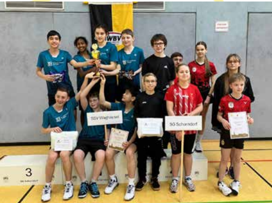
Siegerehrung Schüler U15 (oben) und Jugend U19 (unten)

Text: Ulrich Kolb, SG Schorndorf