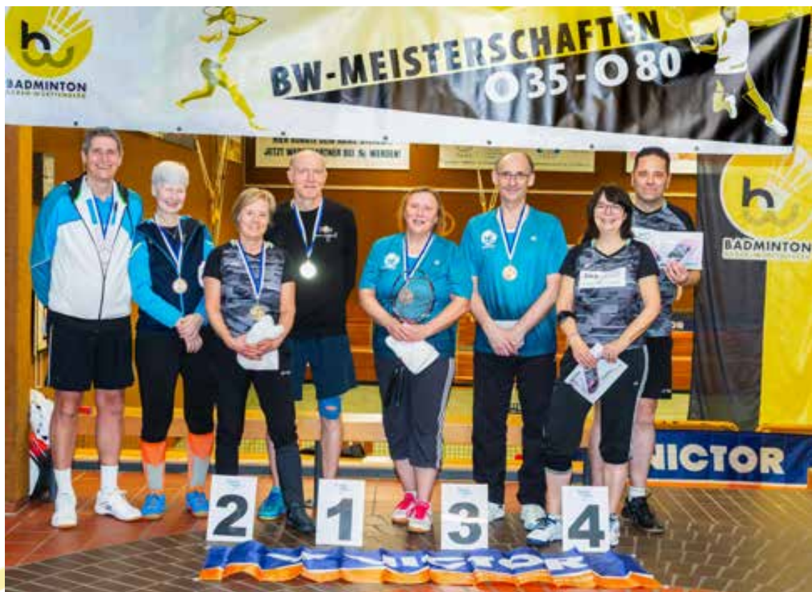
Das Podium Mixed 60 bei der BWBV AK-Meisterschaft in Mössingen