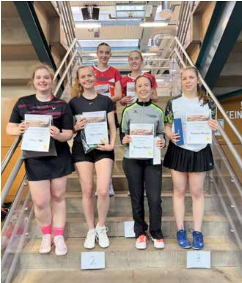
Ehrung im Damendoppel B

Das 2. Ranglistenturnier der Aktiven im Bezirk Südbaden fand am 17. Januar in Schwenningen statt. Antreten konnten die Spielerinnen und Spieler nicht nur in den Disziplinen Einzel und Doppel, sondern zusätzlich auch im Mixed. Dieses erweiterte Angebot fand wie auch schon letztes Jahr guten Anklang.