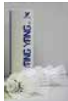
Bälle mit Korkfuß