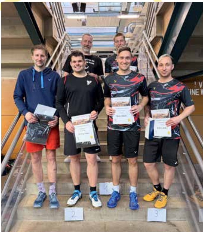
Ehrung im Herrendoppel A

Pünktlich gegen 16 Uhr konnten die Mixed-Spiele begonnen werden. In der A-Klasse gingen für die Turnierleitung undankbare neun Paarungen an den Start, während in der B-Klasse acht Teams um den Sieg kämpften.