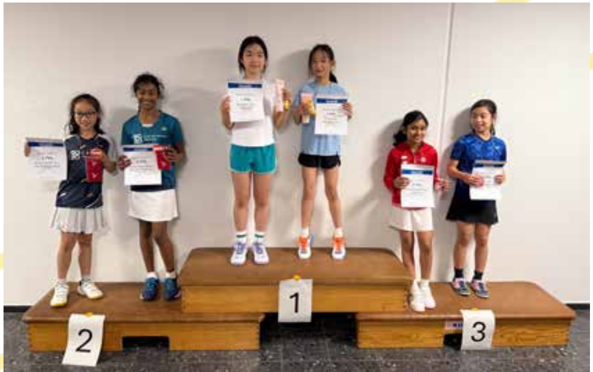
Das Podium im Mädchendoppel U13 bei der dritten E-Rangliste in Dossenheim