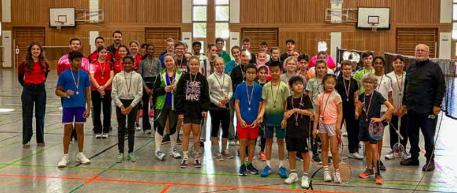
Teilnehmende und Helfer des Fortuna 96 Cup 2025