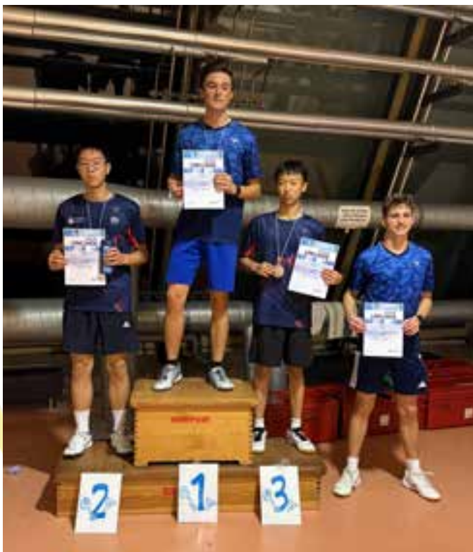
Podium Mädcheneinzel U15