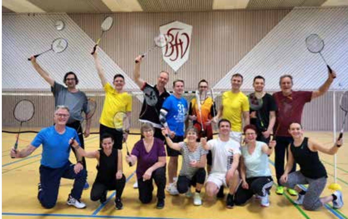
Die Teilnehmerinnen und Teilnehmer beim Spielerlehrgang in Schöneck