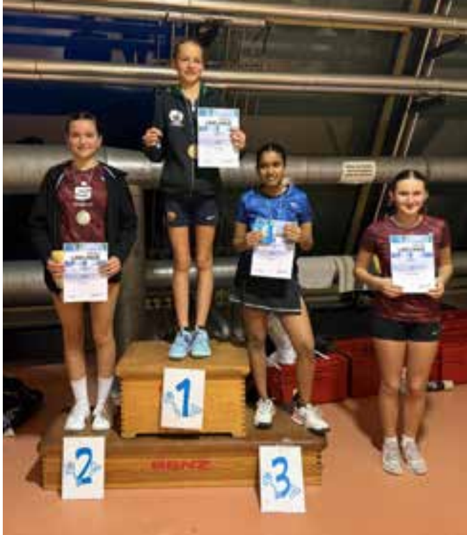
Podium Mädcheneinzel U15