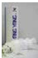
Bälle mit Korkfuß