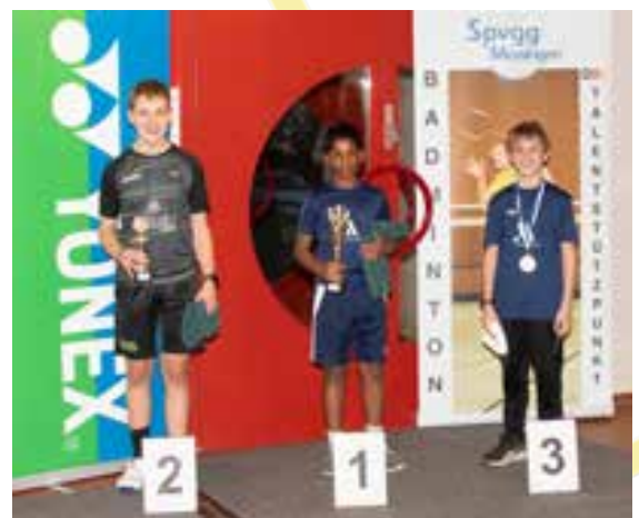
Podium Mädcheneinzel U19 und Jungeneinzel U13