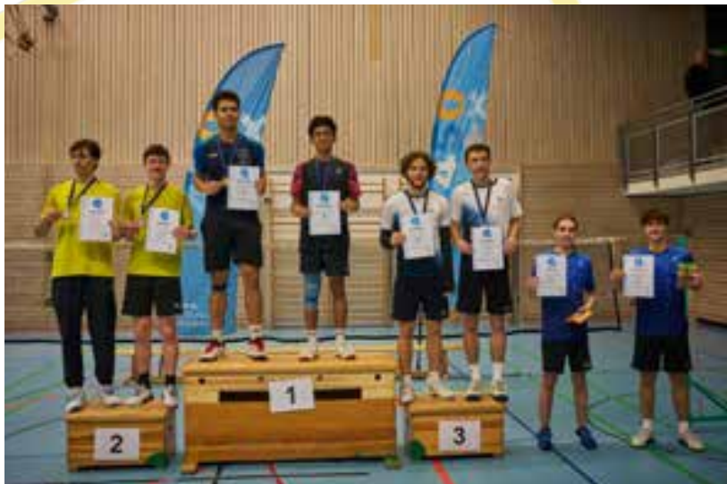
Siegerehrung Jungendoppel U19

Ab 16.30 Uhr konnten dann die Doppel starten. In der Altersklasse U11 und U13 galt die Regelung „Doppel ohne Hinterfeld“, eine recht ungewohnte Spielform, die zum ersten Mal in dieser Saison zum Turniermodus gehörte. Alle Altersklassen waren besetzt und konnten ausgetragen werden. Ohne große Spielpausen konnte die Siegerehrung fürs Doppel gegen 19 Uhr durchgeführt werden.