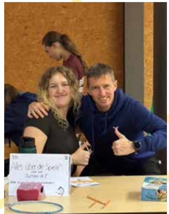
Spaß fängt in der Turnierleitung an