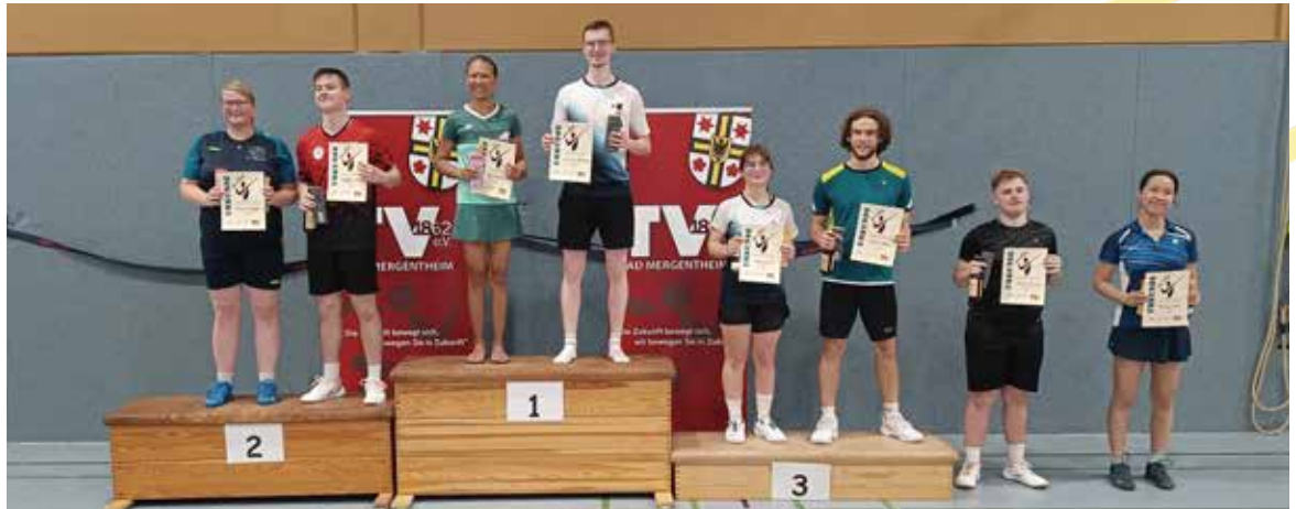
Siegerehrung im Mixed

Am 27. September fand in Bad Mergentheim die Nordwürttembergische Meisterschaft 019 des Baden-Württembergischen Badminton-Verbands statt. In den Disziplinen Einzel, Doppel und Mixed traten zahlreiche Spielerinnen und Spieler aus der Region an, um die Titel in spannenden Begegnungen auszuspielen. Das Turnier war geprägt von einem hohen sportlichen Niveau, fairen Spielen und einer hervorragenden Organisation durch das Ausrichter-team vor Ort.