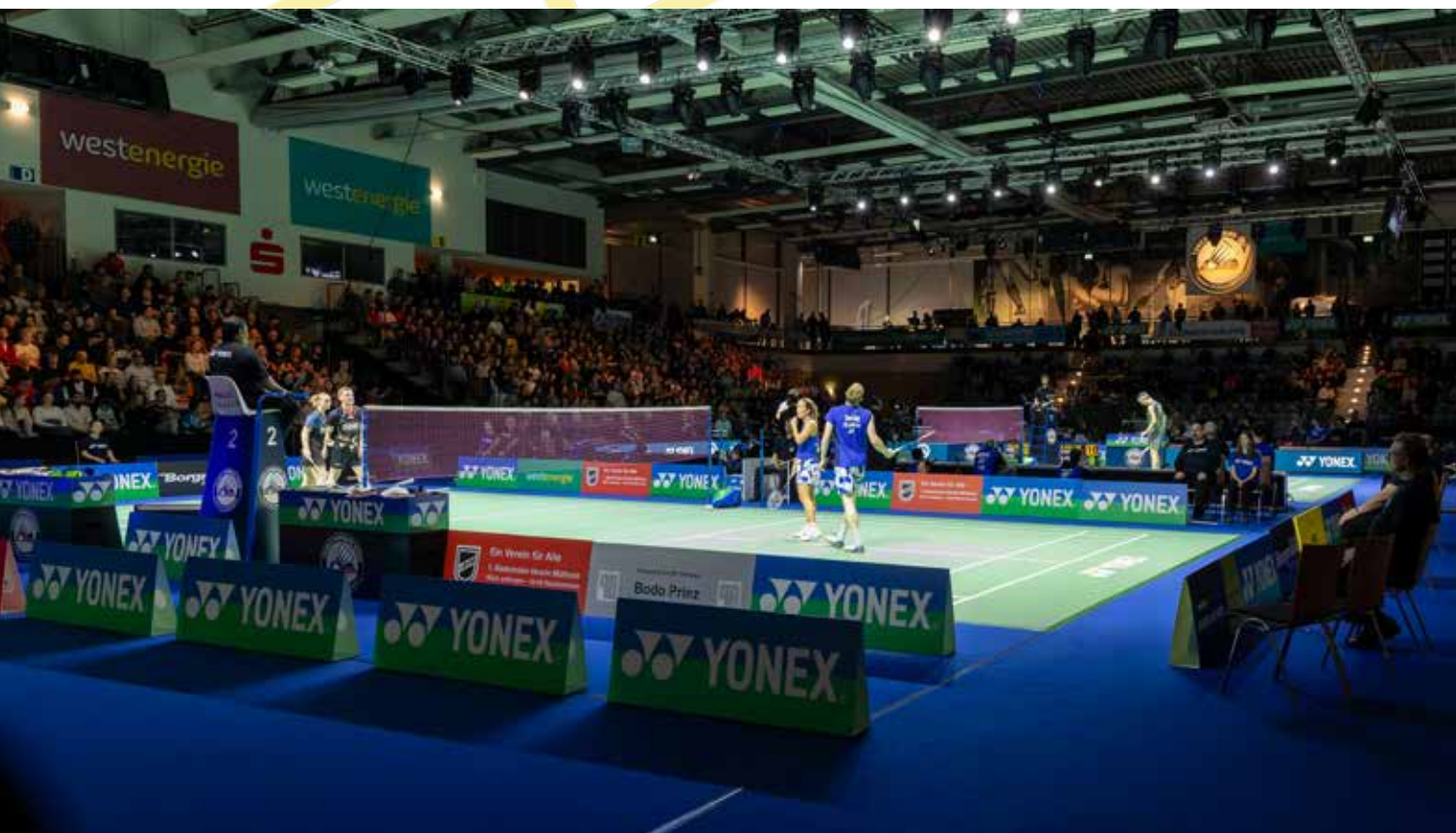
Heiß begehrt sind jedes Jahr die Plätze im Halbfinale der German Open

äußerst beliebte – Turnier im kommenden Jahr einmal mehr den Auftakt der Europatour: Auf die YONEX German Open, die in der Kalenderwoche 9 ausgetragen werden, folgen in den Kalenderwochen 10 bis 12 weitere Topevents in England (Birmingham; HSBC BWF World Tour Super 1000), in der Schweiz (Basel; HSBC BWF World Tour Super 300) und in Frankreich (Orléans; HSBC BWF World Tour Super 300).