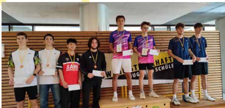
Siegerehrung Jungeneinzel U19