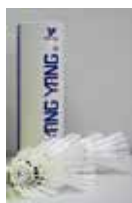
Bälle mit Korkfuß