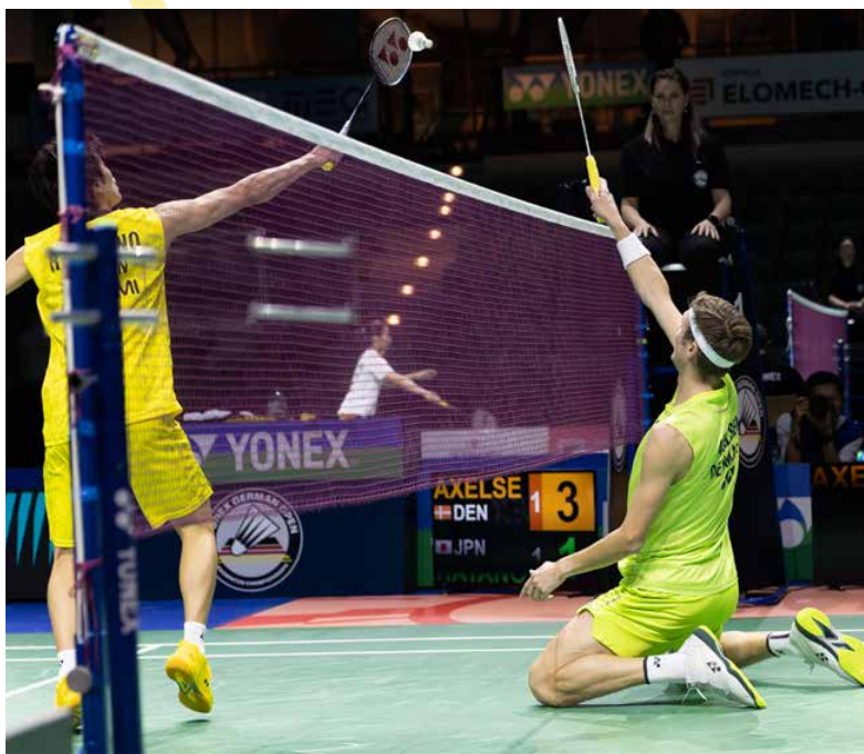
Trennung und Rücken-OP – 2025 ist kein schönes Jahr für Olympiasieger Viktor Axelsen (rechts)