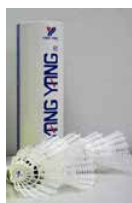
Bälle mit Korkfuß