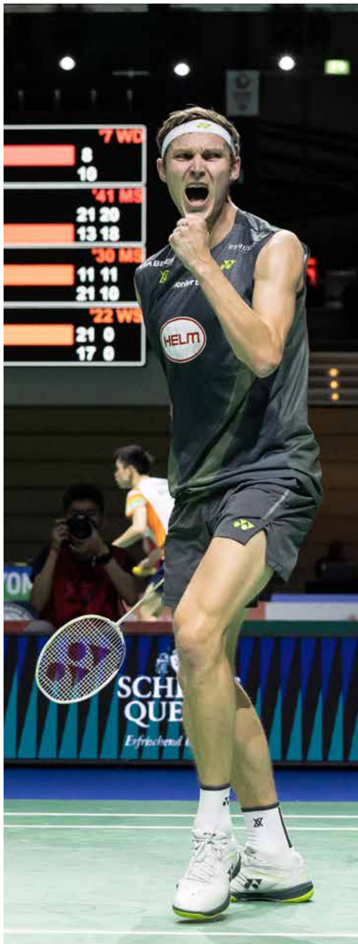
Titelfoto: Viktor Axelsen