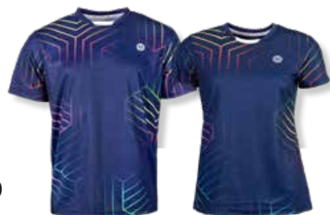
DENVER T-Shirt Art. 8220