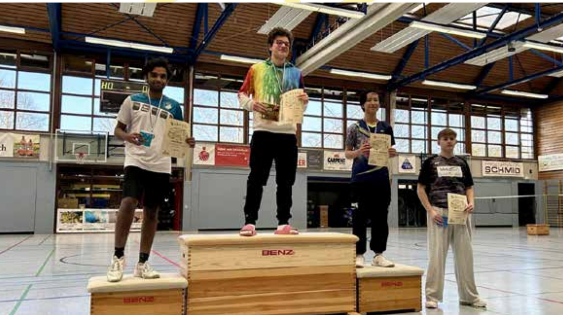
Siegerehrung im Herreneinzel U19

Platzierungen ohne Verletzungen ausgespielt und man konnte auf einen erfolgreichen Turniertag zurückblicken.