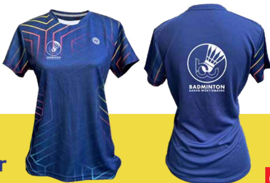
DENVER Lady T-Shirt Art. 8230