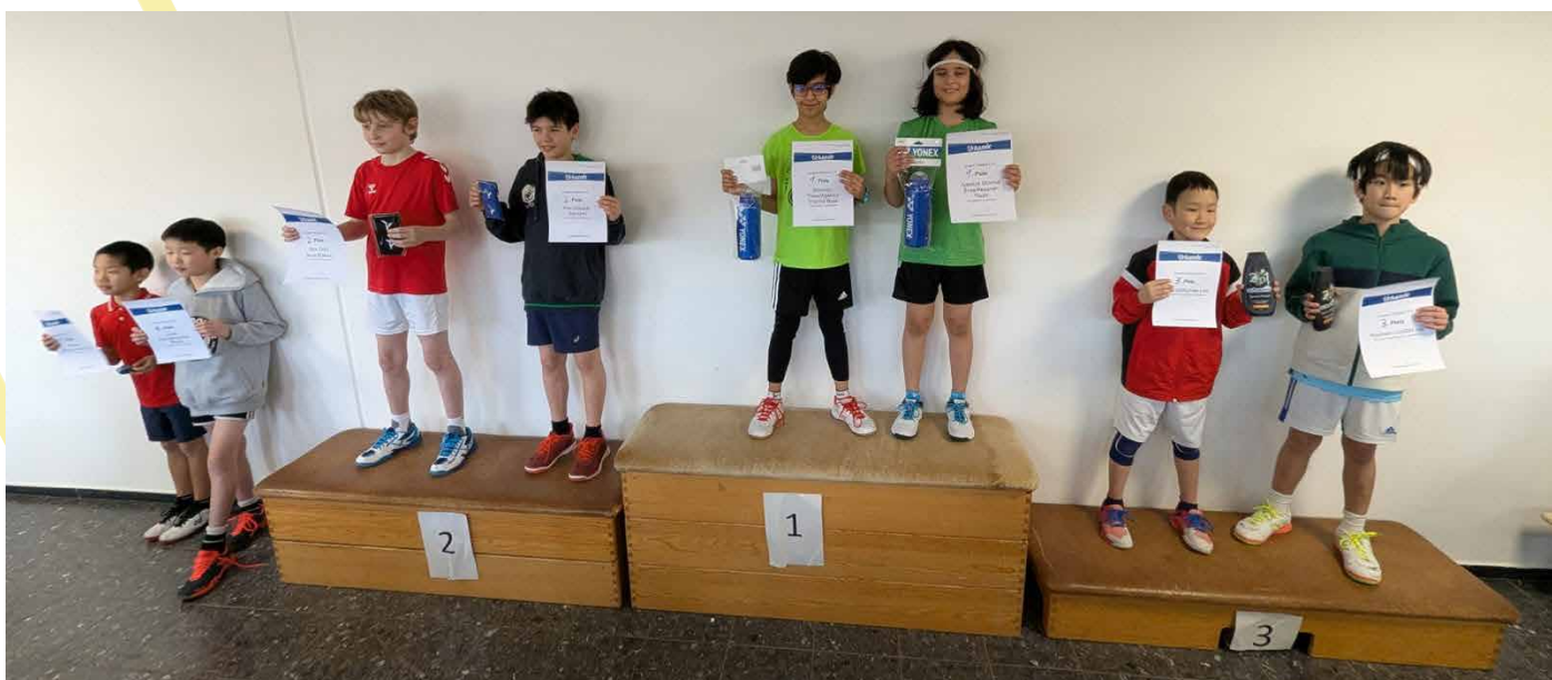
Siegerehrung im Jugenddoppel U13