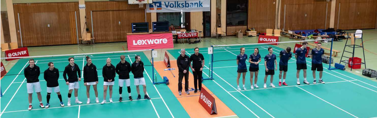
Tabellenführer TSV Neuhausen (links) und der BC Offenburg