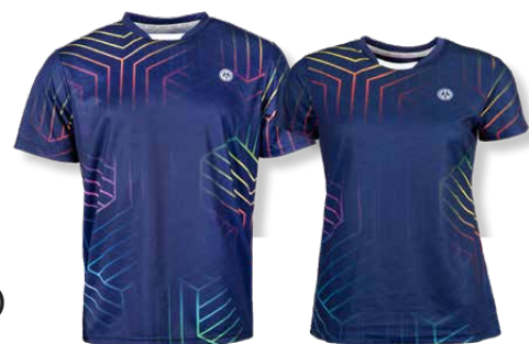
DENVER T-Shirt Art. 8220