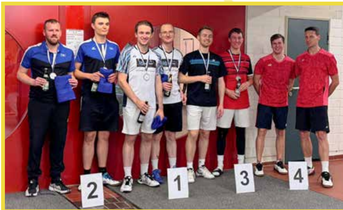
Die vier Erstplatzierten im Herrendoppel A