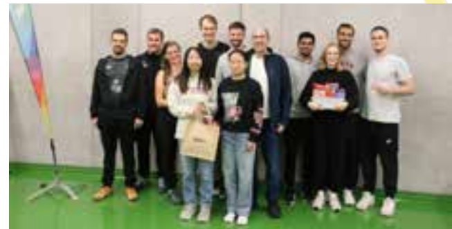
Sieger der B-Klasse: v.l.n.r.: 3. Die Federball-Fetischisten, 1. Auf Feld Drei, 2. Power Smasher