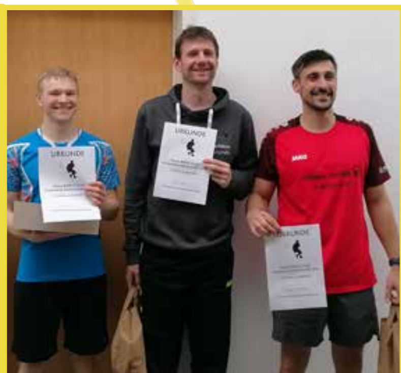
Die jeweils drei Erstplatzierten im Dameneinzel (links) und Herreneinzel (rechts) | Fotos: Daniel Badstöber