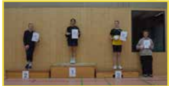
Siegerehrung Mädchen Einzel U13

Im Jungeneinzel U13 waren es 19 Teilnehmer, sodass zunächst eine Qualifikation ausgespielt wurde und anschließend ein 16er Feld. Die Altersklasse war sehr umkämpft und von einigen Dreisatzspielen geprägt. Der auf eins gesetzte