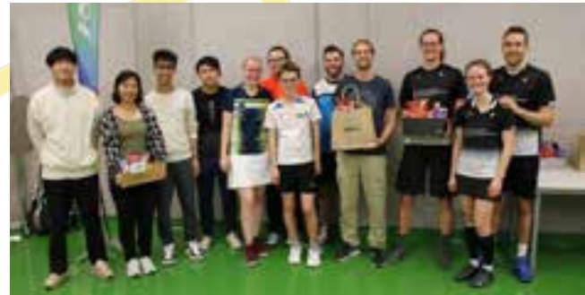
Sieger der A-Klasse: v.l.n.r.: 3. Jumping Smash, 1. the Muffin men, 2. Nimm 3

Wir bedanken uns bei allen Anwesenden für das schöne Turnier und freuen uns wie auch alle Teilnehmenden auf ein Wiedersehen im kommenden Jahr!