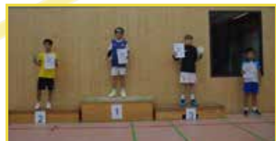
Siegerehrung Jungen Einzel U13

Das Mädcheneinzel U15 war mit 17 Teilnehmerinnen gut besetzt. Nach der Qualifikation wurde ein 16er Feld ausgespielt. Hier kam es im Finale zu einem spannenden Match zwischen