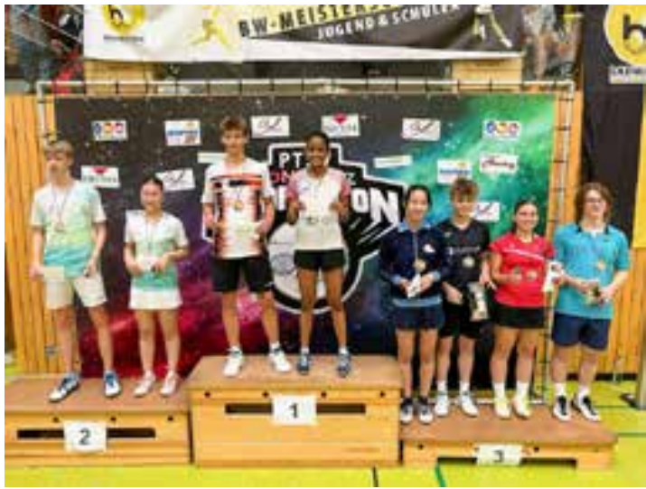
Siegerehrung Mixed U17