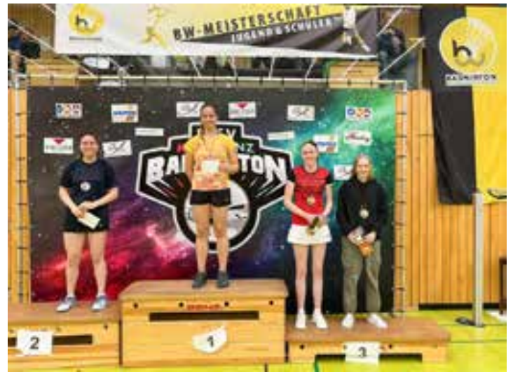
Siegerehrung Mädcheneinzel U19

Ergebnisse und Turnierbäume bei turnier.de