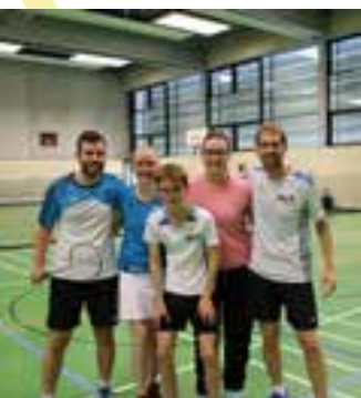
the Muffin men

Natürlich war auch der PSV mit drei Mannschaften vertreten - mit zwei Teams in A und einer Mannschaft in B. Sowohl „the Muffin men“ als auch „Können Nichts, spielen trotzdem“ konnten sehr gut in A mithalten und konnten dann auch den Heimsieg holen. Hier