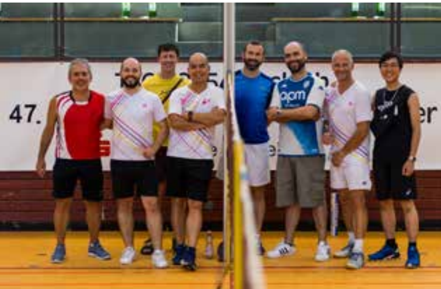
Das Team aus Fontenay-aux-Rose

Text und Fotos: Silke Vormbrock, TSG Wiesloch