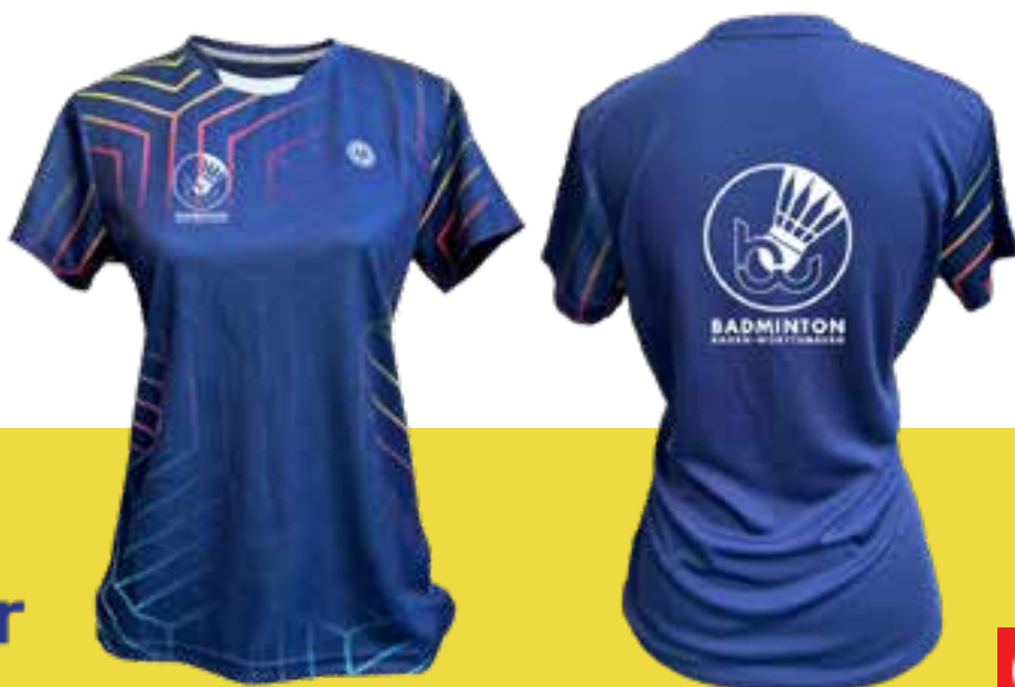
DENVER Lady T-Shirt Art. 8230