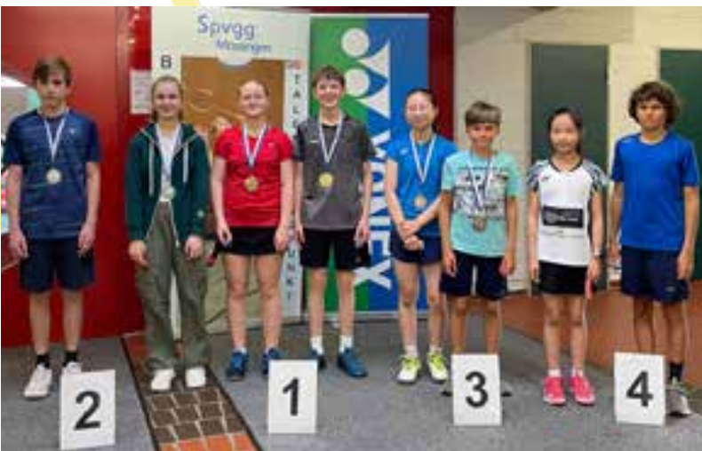
Podium Mixed U15