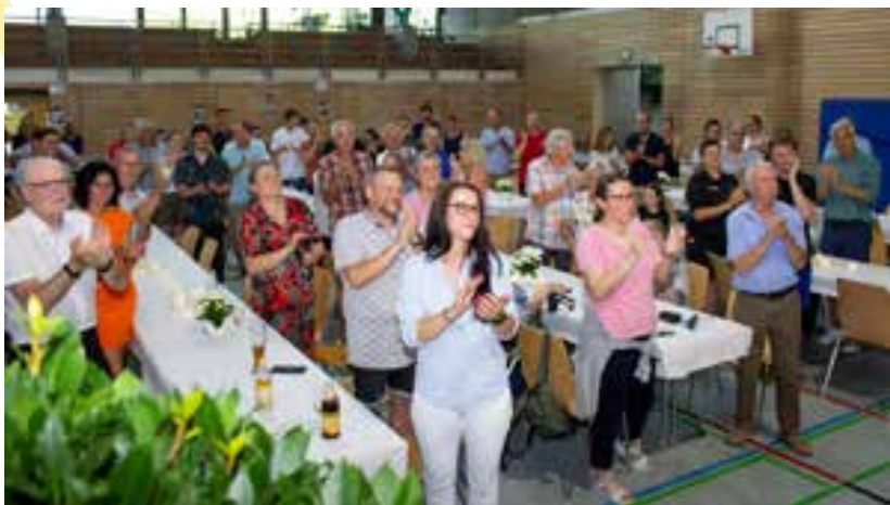
Applaus der Gäste beim Jubiläum in der Jahnhalle