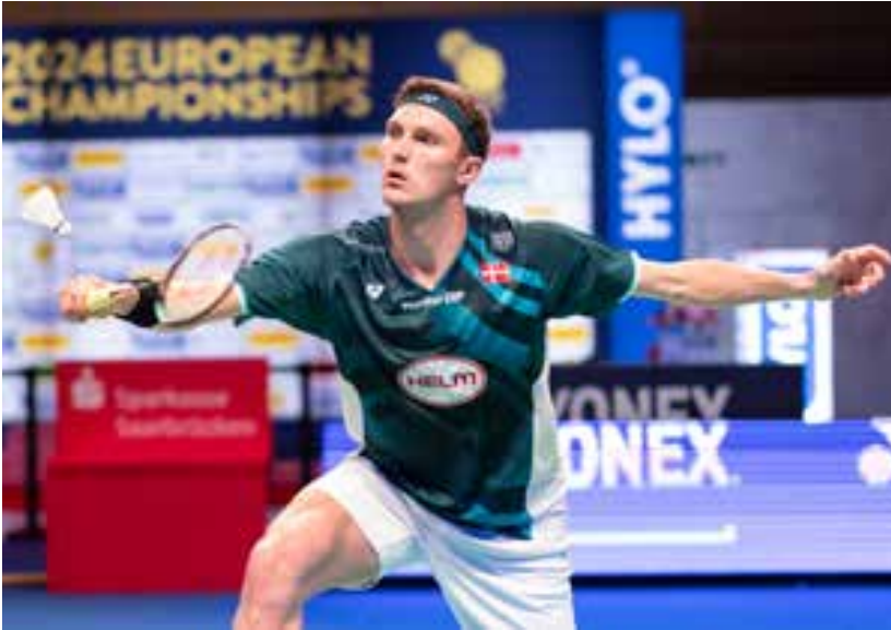
Viktor Axelsen