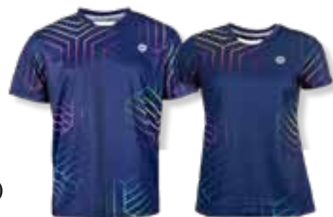
DENVER T-Shirt Art. 8220