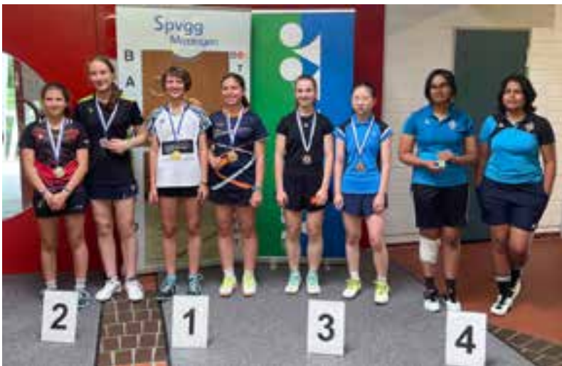
Podium Mädchendoppel U17

Text: Jörg-Andreas Reihle, Spvgg Mössingen