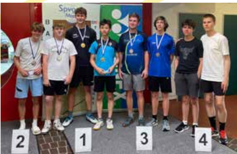
Podium Jungendoppel U17

Bericht mit Platzierungen und mehr Fotos auf bwby.de