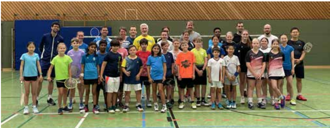
Gruppenfoto beim Small-Games-Lehrgang in Herrenberg